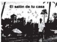
El salón de tu casa