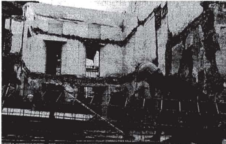
Una panorámica de las obras para la adecuación de un edificio municipal, ayer en Ubrique.

De los cuatro proyectos solicitados por el Ayuntamiento bosqueño, dos están ya finalizados. Uno de ellos se ha centrado en la adecuación del acceso al polígono industrial de Huerto El Blanquillo, en el que se ha invertido 147.300 euros, dando empleo a 13 personas. La otra actuación tiene que ver con la mejora de las infraestructuras educativas del colegio Albaracín, que requirió ayer, también, la presencia de la delegada provincial de Educación de